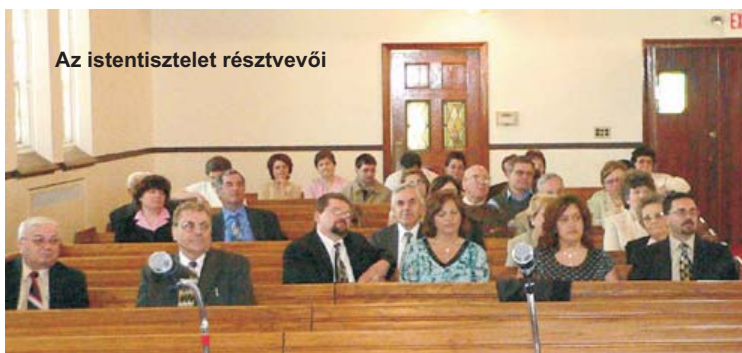
Az istentisztelet résztvevői