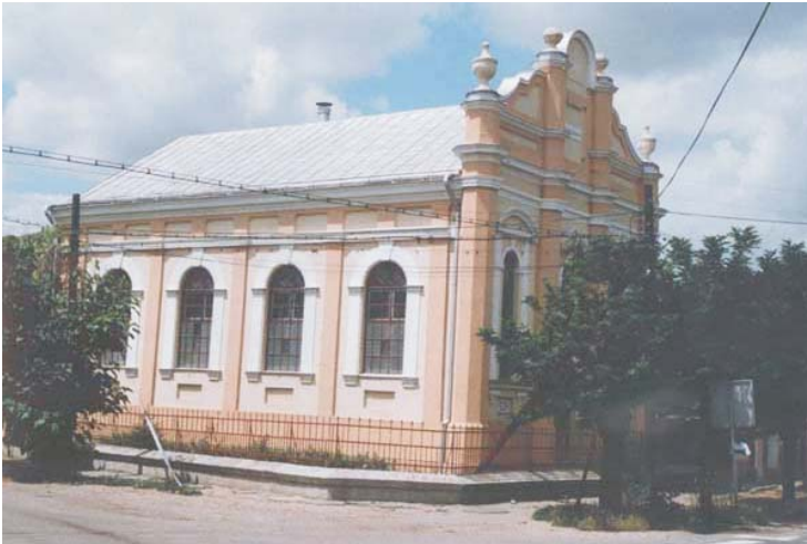
A nagyszalontai magyar baptista imaház

“NAGYSZALONTA NEVEZETES VÁROS...” – így kezdi versét Arany János , az egyik legnagyobb magyar költőnk (Az Ó torony). Annak dacára, hogy lakossága ma sem haladja meg a 20 ezer főt, mégis a négy évszázad alatt sok fontos esemény tanúja lehetett e kis város és sok híres ember látta meg itt a