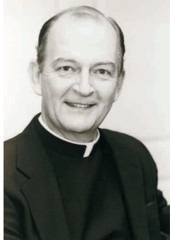
Richard John Neuhaus

72 éves korában elhunyt korunk egyik legnagyobb gondolkodója, Richard John Neuhaus. A neve talán nem annyira ismert Amerikán kívül, mint például a kultúrák ütközéseit elemző Huntingtoné (ő is meghalt néhány hete), de a munkássága sokkal mélyebb nyomot hagy az amerikai társadalmon és azon túl is, mint sok nagynevű kortársáé. Nehéz megtalálni rá a pontos jelzőt; nincs kategória, ami átfogná azt az életutat, amit