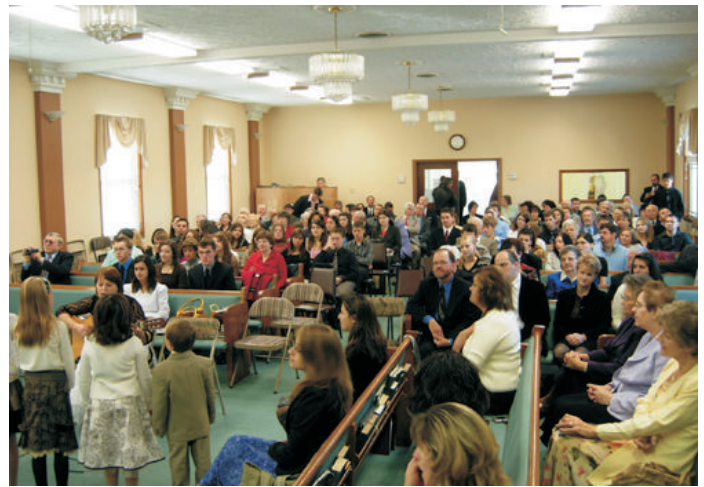
Az ifjúságra sokan eljöttek. Vasárnap teljesen megtelt imaházunk

lkip. tartotta a reggeli áhítatot. Az áhítat után, csoportokra osztva indultunk el a clevelandi állatkertbe, ahol egy Scavenger Hunt (csoportos játék) foglalta le egész napi programunkat. Az állatkert után finom meglepetési vacsora várt minden kedves vendégünkre. A clevelandi lányokkal népies öltözetben szolgáltunk fel a finom magyar ételekből álló vacsorát (csirke paprikás, galuskával). De ezzel még nem lett vége a meglepetéseknek, mert vacsora után megemlékeztünk az októberi születésüekről, akiknek