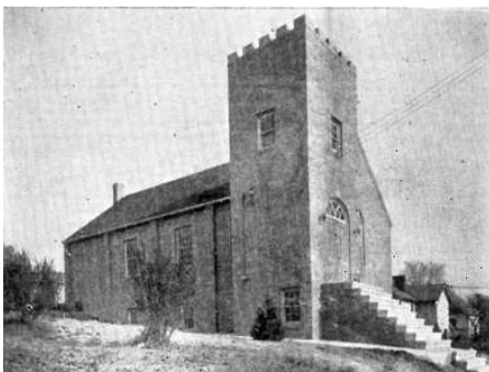
New Castle, PA. Imaház, 1938-as felvétel.

Hat államban, 13 gyülekezet angol nyelvre tért át, egyesültek más gyülekezettel vagy teljesen megszűntek. Ezek voltak: Dante és Morgantown, IN; East Chicago, IL; Flint, MI; Cleveland-Holton Street és Martins Ferry, OH; Bethlehem, Homestead, Mc-