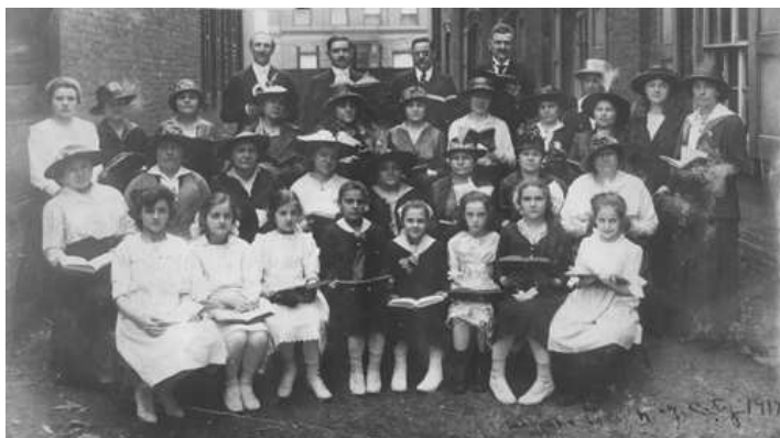
Énekkar, New York, 1917.

Kilenc államban, 33 gyülekezetnek nem volt saját imaházuk. Los Angeles, San Diego és American-Immanuel, CA; Mansfield Center, Ashford és Roseton, CT; Hamond, IN; Lansing és Prescott, MI; So. River, Newark, Flemington, Linden, Pasaic és Franklin, NJ; Greenpoint, Medina és Roseton, NY; Chery Valley, Columbus, Barberton, Dayton, Masury, Lorain, Toledo és Warren, OH; Cannonsburgh, Beaver Falls, Ellwood City, Goff, Philadelphia és Sharon, PA. Ward, West Virginia.