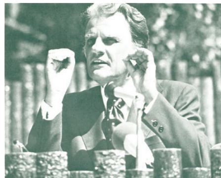
Dr. Billy Graham preaching in Hungary at the Tahi Baptist Camp, Sept 4, 1977.