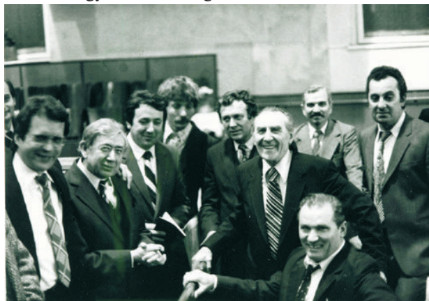
Héthalmi testvér tanítványai és munkatársai körében. A felvétel 1988-ban készült a Wesselényi utcában.

Zeneszerzői munkásságának másik iránya a zeneileg könnyebb un. Evangéliumi énekek vonala. Úgy érezte, hogy ez a stílusú ének közelebb férkőzik a szívhez, az érzelmeken keresztül jobban beállítja a lelket az evangélium üzenetére. Kiemelkedik ebből a stílusból a „Jöjjön el a Te országod” (hatszólámú), a „Te légy velem” (nyolcszólámú), a „Jézus csodás kegyelme” (négyyszólámú) vegyeskari feldolgozás.