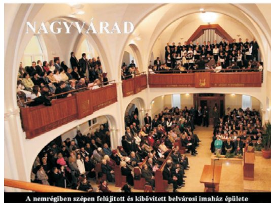
A nemrégiben szépen felújított és kibővített belvárosi imaház épülete

Több építkező gyülekezet van Erdélyben, ezek közül például Mihályfalva, Szentimre, és Szilágybála. A nagyváradi belvárosi imaház renoválva volt és így most egy szép felújított, kibővített templom áll a gyülekezet rendelkezésére. A cigányok közötti misszió tovább fejlődött az elmúlt évben. Több gyülekezet alakult és voltak olyan cigány gyülekezetek,