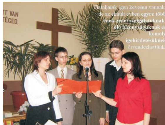
Fiatlajaink igen kevesen vannak, de az elmúlt évben egyre több ének-zenei szolgálatuknak, élő biznyságuknak és komoly igehirdetésüknek örvendezhettünk.

gatását, hogy a rendszeres látogatóink szívében fogant hit erősödjön meg anynyira, hogy nyilvánosan a bementés vizében is megvallják azt, és beépüljenek gyülekezeteinkbe.